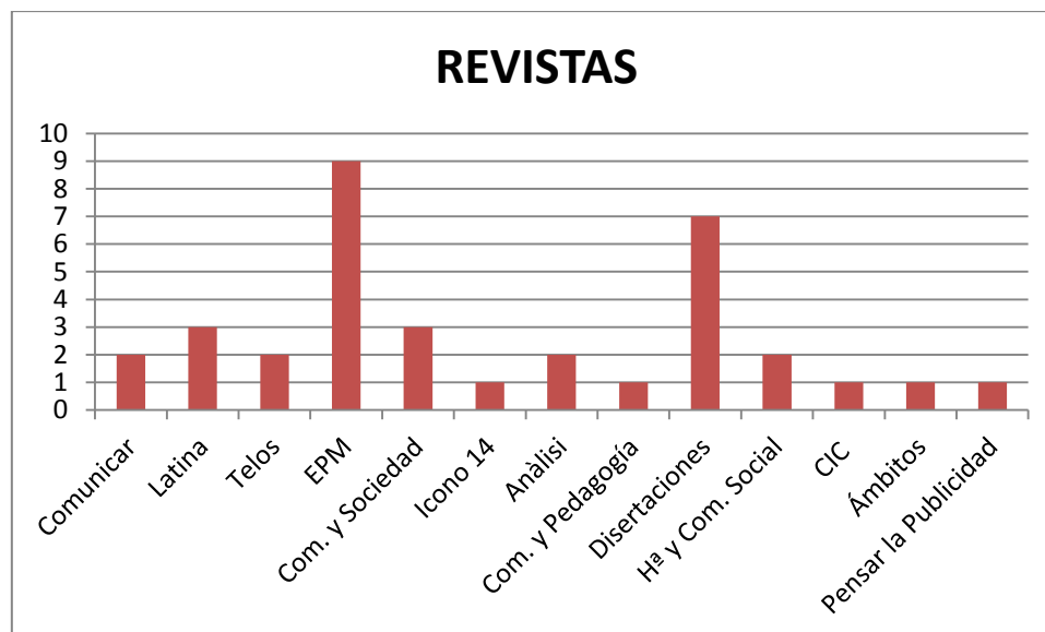
Tabla 3. Número de artículos por revista